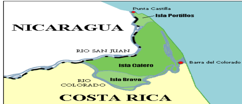
Figura 2: Bifurcación del río San Juan en dos brazos: San Juan inferior y río Colorado, y situación geográfica de la Isla Portillos.

situada a una veintena de kilómetros al Sureste de la desembocadura del San Juan inferior (ver figura 2). Actualmente, el Colorado transporta alrededor del 90% del caudal total del San Juan, mientras que el 10% restante discurre por el San Juan inferior.