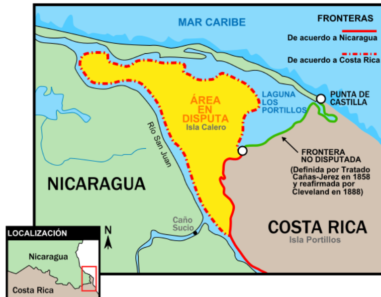
Figura 3: Situación geográfica de la laguna Los Portillos y el territorio litigioso.

El territorio situado entre el río Colorado y el curso inferior del río San Juan se designa con el nombre de Isla Calero (150 km 2 ), y engloba una zona más pequeña situada al Norte que Costa Rica denomina Isla Portillos y Nicaragua Harbor Head (17 km 2 ). En la parte septentrional de Isla Portillos se encuentra la laguna denominada por Costa Rica Los Portillos y Harbor Head por Nicaragua (ver figura 3), actualmente separada del mar por una formación arenosa. Isla Calero forma parte del Humedal Caribe Noroeste , designada el 20 de marzo de 1996 Humedal de Importancia